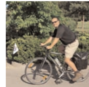
C'est parti pour 70 kilomètres