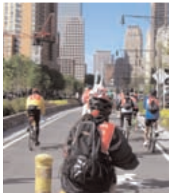
Sur les pistes cyclables de New York