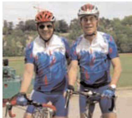
Aux couleurs du club