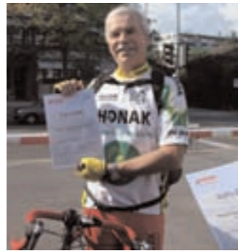
Un diplôme mérité