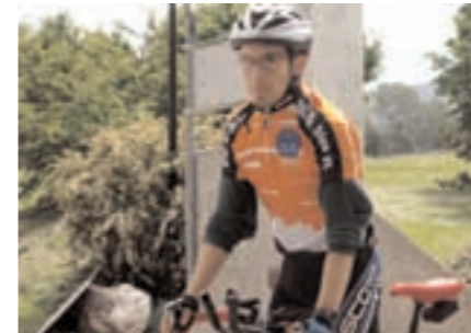
Vessy, prêt au départ

Le calendrier périodique est disponible sur notre site ou sur demande au CTC, case postale 18, 1226 Thônex