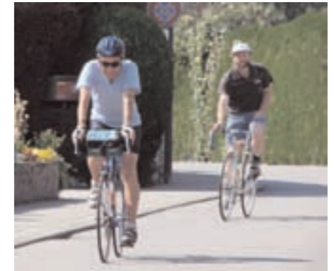
Du côté de Collex