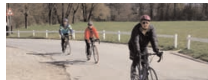
Fin de sortie aux Evaux