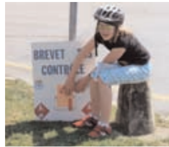
Au contrôle cyclomatique

Dimanche 10 Brevet route 100 km, devenu possible grâce à nos bénévoles! Départ 7h30-10h00, Centre sportif de Sous-Moulin (Thônex). Fermeture de l'arrivée à 16h00. Inscription 15.- (non membres 25.-; moins de 18 ans, gratuit).