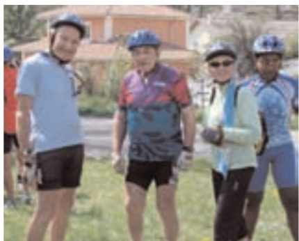
Au ravitaillement du brevet