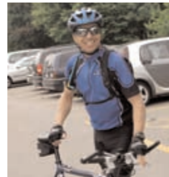
Cyclo tout sourire