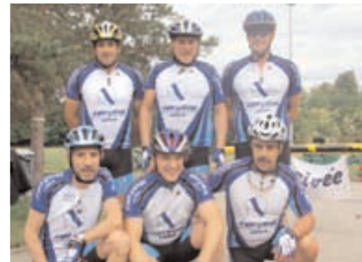
En équipe, au départ du brevet Jean Brun