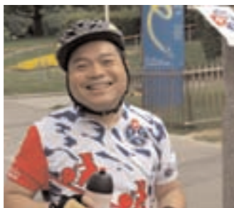
Que du bonheur!

Mercredi 5 Sortie route Genève-Lausanne, accompagnant les participants au Tour à travers la Suisse dans leur 1ère étape. Départ 9h00, Jonction, Hôtel Le