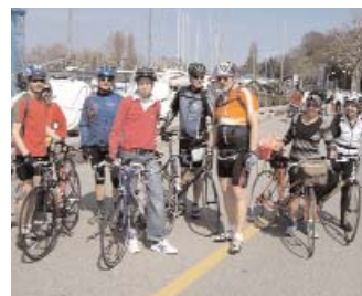
A Genève-plage, sous le soleil

Sortie de clôture, 40 km. Pour finir la saison, avec le repas de clôture sur les mêmes dents. Départ 9h30, Veyrier, place de l'Eglise.