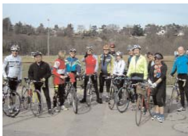
Stade de Vessy, le départ

Place du Cirque - 1204 Genève - Tél. & Fax 022 328 21 26