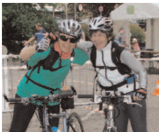
Le vélo, c'est trop top!

Sortie Dames , 75 km environ. Une sortie vélo que pour vous Mesdames. Départ 13h00, centre sportif de Vessy.