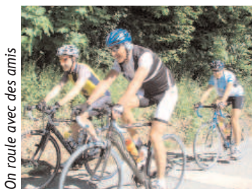
On route avec des amis

Nous avons plein d'idées pour organiser toujours plus d'activités, non seulement cyclistes mais également de loisirs, et ainsi de partager notre passion.