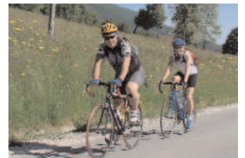
Derrière le Salève

De Lausanne aux Rasses (le samedi) et des Rasses à Neuchâtel (le dimanche), on profite du week-end pour accompagner les participants au Tour à travers la Suisse dans leur périple. (☺)