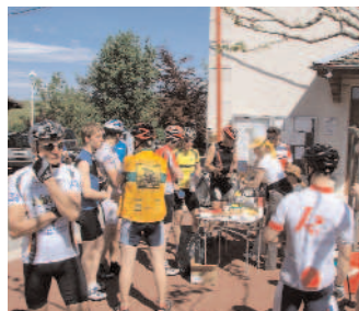
60 ou 100km, à choix