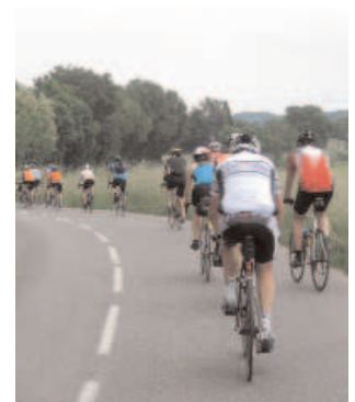
Dans notre belle campagne

Nous vous attendons donc nombreux, avec plaisir.