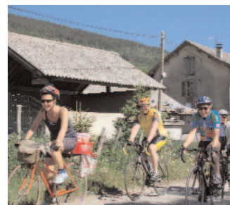
Après La Muraz